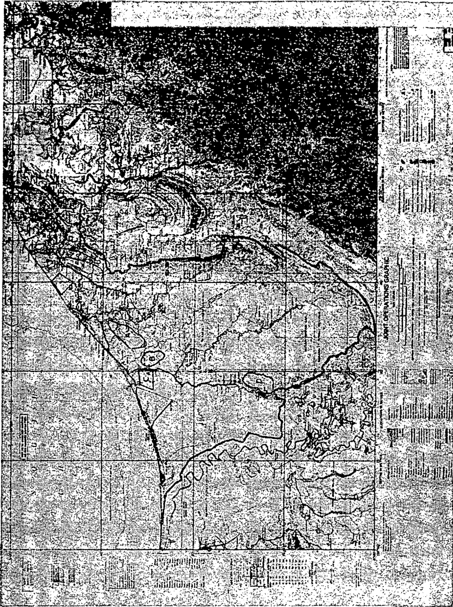
This map is not considered by either Government as an authority on the delimitation of international boundaries.